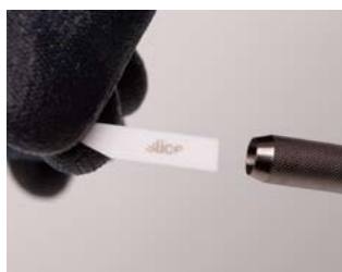
chwyc za ostrze, wymień je na nowe