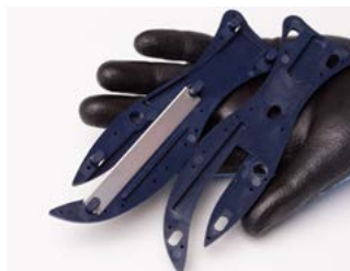
teraz masz dostęp do ostrza