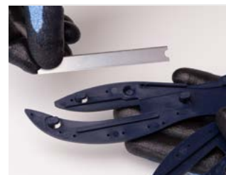
zamień je stronami lub włóż nowe ostrze