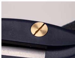
Znajdź śrubę do wymiany ostrza