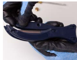
rozłóż dwie połowy rękojeści