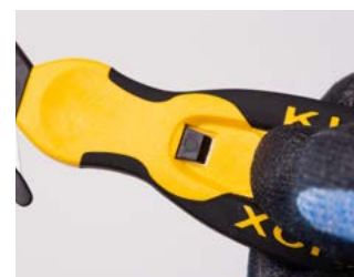
Nóż jest gotowy do użycia