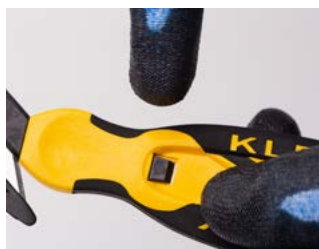
Wciśnij przycisk zwalniający ostrze